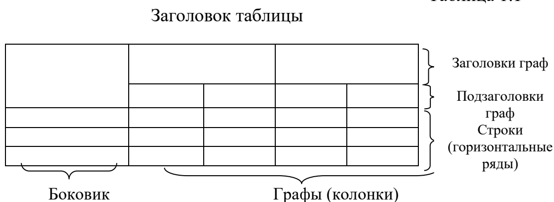
Рис. 1. Структура и вид таблицы

При переносе части таблицы на другую страницу слово «Таблица» и ее номер и заголовок указывают один раз над первой частью таблицы; над другими частями ставят слова «Продолжение табл.» и ее номер или «Окончание табл.» и ее номер.